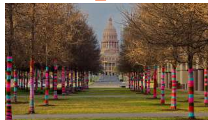
MAGDA SAYEG (2012) Initiatrice du Yarn Bombing en 2005