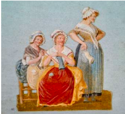
TRICOTEUSES DE LA REVOLUTION «Les tricoteuses Jacobines» des Frères Lesueur