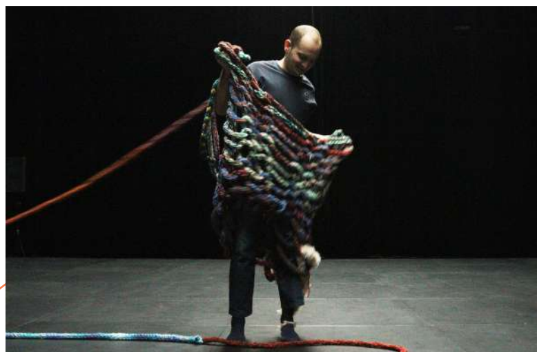
Bercail - 2023

En représentant les tricoteuses à travers la technique qui leur est chère, nous leur rendons hommage tout en réalisant un geste en écho à leur démarche.