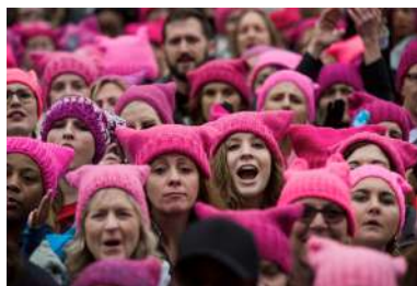
PUSSYHATS (2017) Militantes américaines coiffées d'un pussyhats durant la marche des femmes