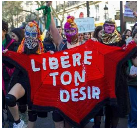
COLLECTIF BRIGADA SERPIENTES (2022)