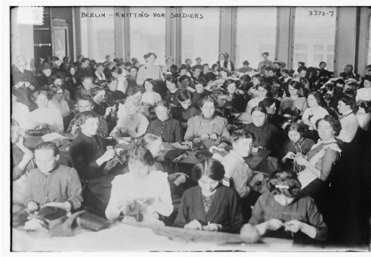
RASSEMBLEMENT DE CEUX QUI NE SONT PAS PARTIS AU FRONT PENDANT LA 1ERE GUERRE MONDIALE pour tricoter des chaussettes aux soldats