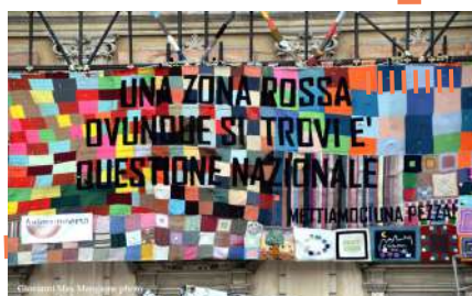
METTIAMOCI UNA PEZZA (2012) Action du collectif Animammersa face à l'inaction du gouvernement à reconstruire la ville de l'Aquila, détruite par un tremblement de terre