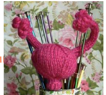
UTERUS TRICOTES POUR PROTEGER LE DROIT A L'AVORTEMENT (2012) Collectif GOVERNMENT FREE VJJ aux Etats-unis