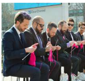
HOMBRES TEJEDORES (2016) Des tricoteurs dans les lieux publics au Chili pour militer contre les stéréotypes de genre.