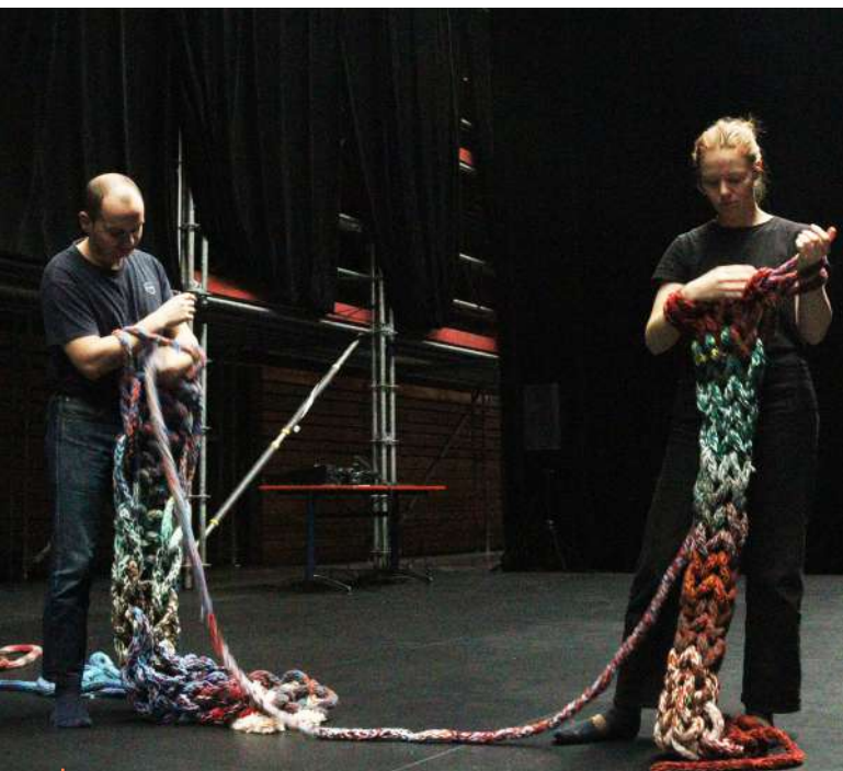
Bercail - 2023

Lors de notre résidence au Bercail à Dunkerque en décembre 2023, on a travaillé sur les possibilités et les limites du tricot au sein d'une forme théâtrale : Comment rendre visible à tout un public un geste tourné vers soi, petit, intime ? Comment pouvons-nous le faire se développer, se construire dans l'espace. Comment le chorégraphier ? Le faire entendre ? Sur la durée limitée d'une représentation, comment représenter et faire ressentir le temps d'un ouvrage tricoté ?