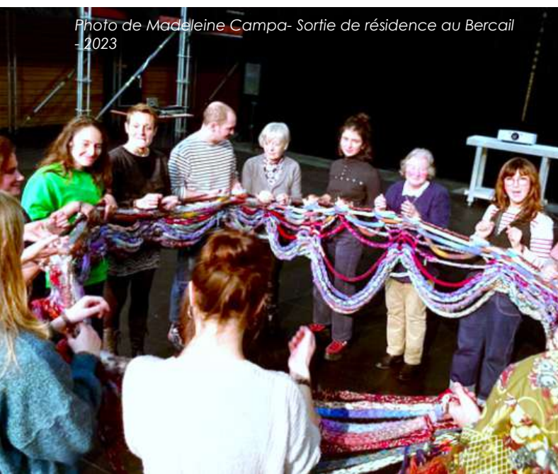
Sortie de résidence au Bercail - 2023

Leurs témoignages nourrissent nos réflexions et sont une matière riche pour l'écriture de notre spectacle.