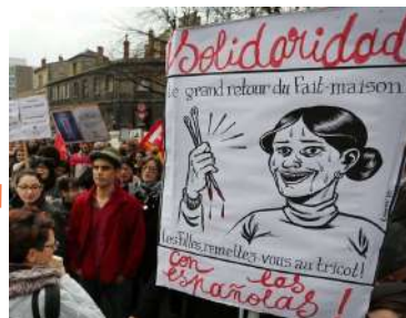
SOUTIEN AUX FEMMES EN ESPAGNE (2014) face à la remise en cause des droits à l'IVG