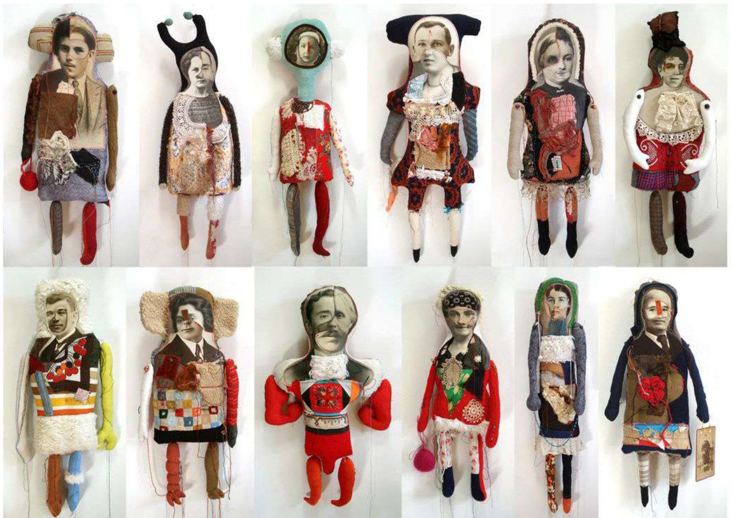
«Poupées» de Cécile Perra-artiste et designeuse textile

Description et présentation : Les élèves créeront des sculptures et petites installations en s'inspirant du conte de Blanche-Neige et en utilisant des objets récupérés du quotidien et des jouets d'enfance. Les créations peuvent inclure des représentations de la forêt, des personnages, de la maison des 7 nains, etc